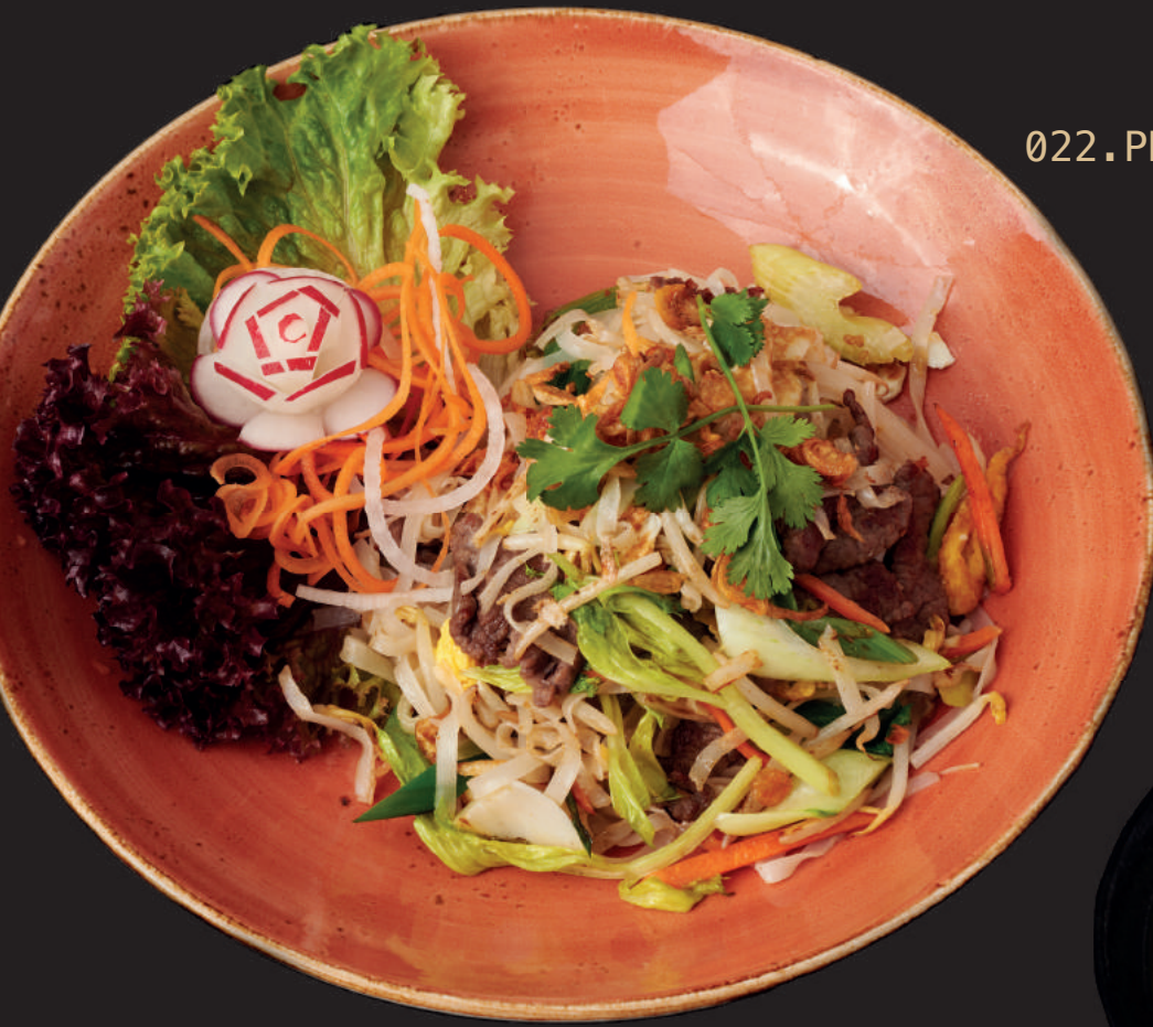
022.PHO XAO BO