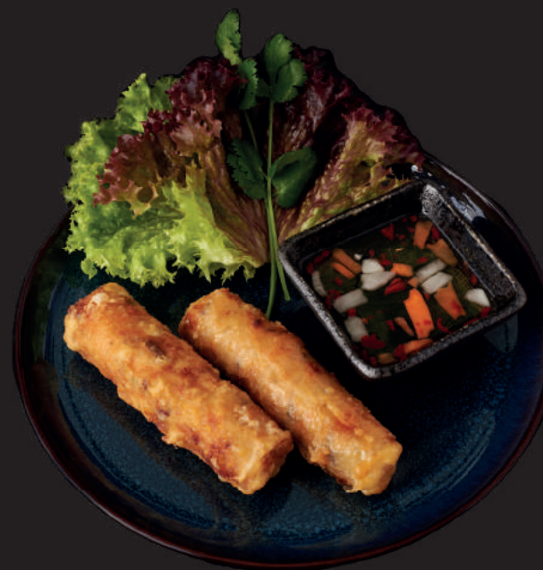
012. NEM GA