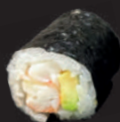
M19. GARNELE & AVOCADO 7,00€