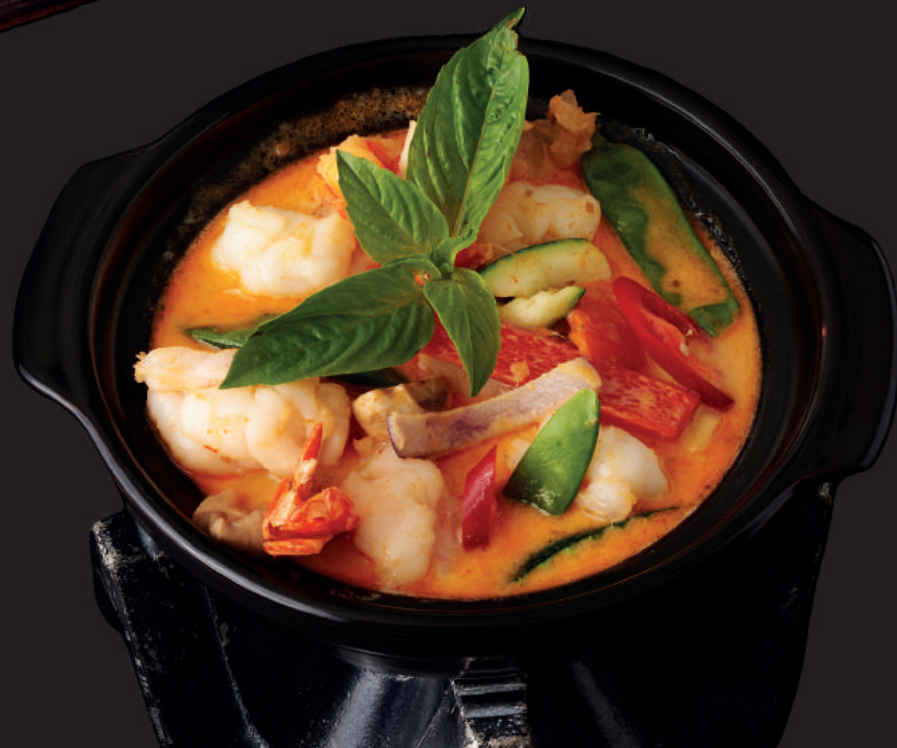
078.TOM XAO & CARI DO