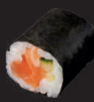
M8. LACHS GURKE 6,50€