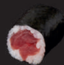
M9. TUNA 7,00€