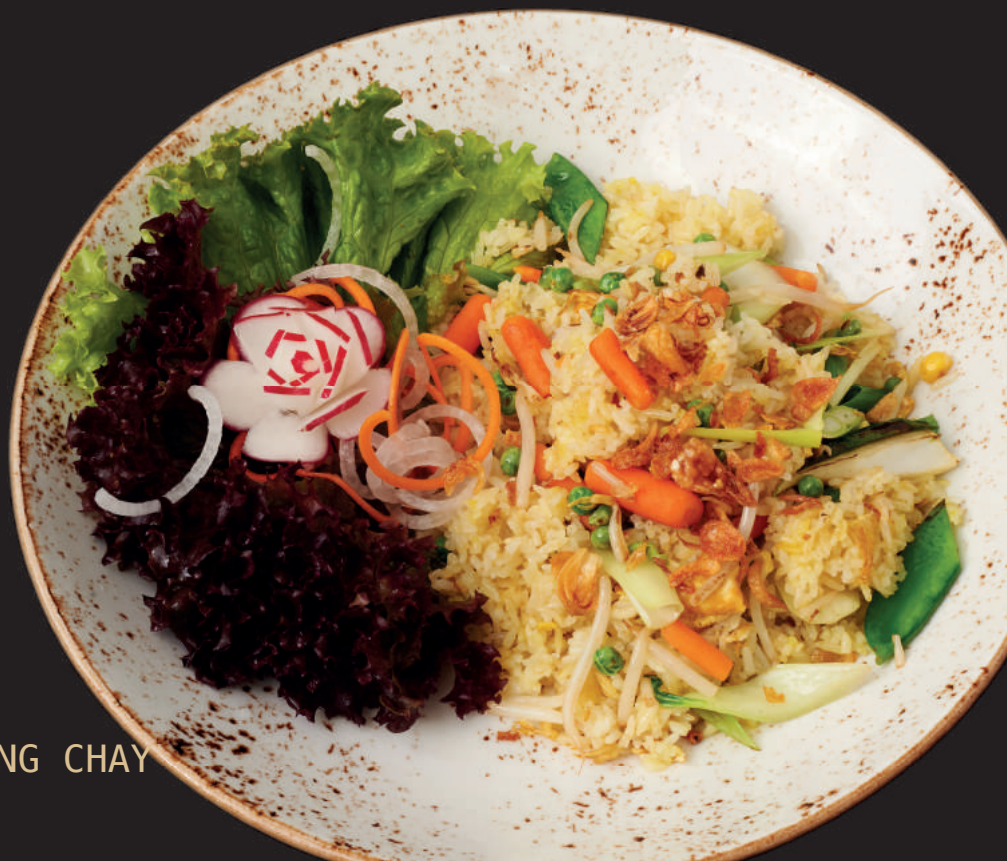
036.COM RANG CHAY