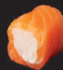
M13. SALMON ROLL MIT FRISCHKÄSE 9,00€