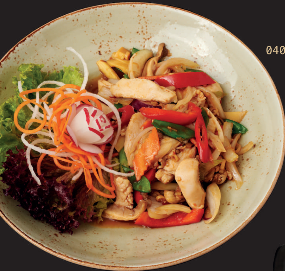
040.GA THAP CAM