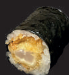
M17. FRITTIERTE GARNELE MIT FRISCHKÄSE 7,00€