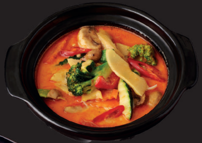
043.GA DO CARI (GEGRILLT)