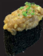
N18. GUNKAN TUNA (SCHARF) TUNATATAR, AVOCADO, SPICY SAUCE, SESAM ÖL, FRÜHLINGSZWIEBELN 4,50€