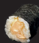
M18. KNUSPRIGE LACHSHAUT 6,00€