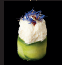
N8. WHITE TULIP FRISCHKÄSE IN DÜNNEN GURKENSCHNITTEN 4,00€