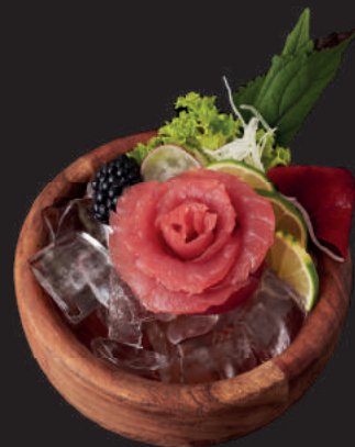
SASHIMI TUNA 16,90€