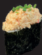
N17. GUNKAN LACHS (SCHARF) LACHSTATAR, AVOCADO, SPICY MAYO, FRÜHLINGSZWIEBELN 4,50€