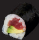
M10. TUNA AVOCADO 7,00€