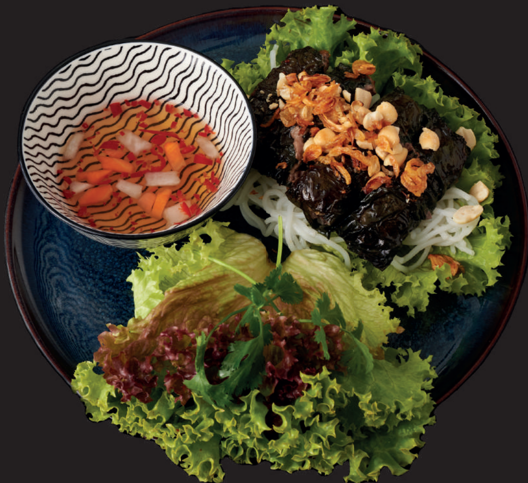
006. CHA BO LA LOT