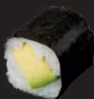
M2. AVOCADO 5,00€