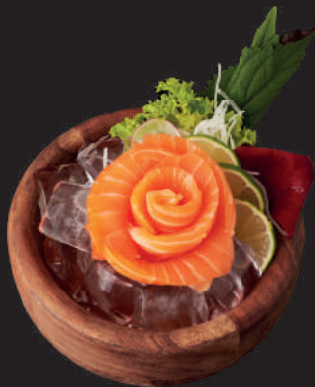
SASHIMI LACHS 14,90€