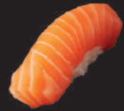
N4. LACHS 3,50€