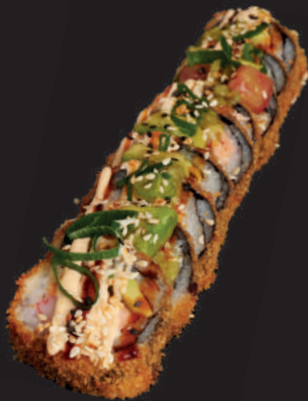
I21. THE KC