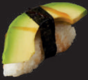
N1. AVOCADO 3,00€