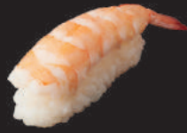
N2. GARNELE 3,00€