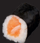
M6. LACHS 6,50€