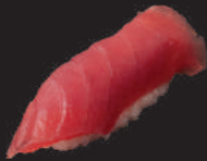
N5. TUNA 4,00€