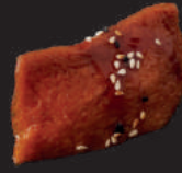
N3. TOFU 2,50€