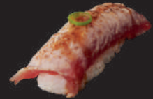
N15. PEPPER TUNA 4,50€