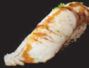
N13. FLAM. JAKOBSMUSCHEL 4,50€