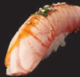
N14. PEPPER SALMON 4,00€