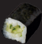
M1. GURKE 4,00€