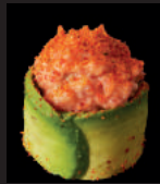
N9. TULIP LACHSTATAR LACHSTATAR MIT SPICY MAYO GEWICKELT IN AVOCADOSCHNITTEN 4,50€