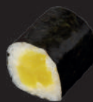
M3. RETTICH 4,50€