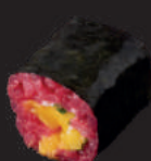
M16. MANGO RUCOLA & FRISCHKÄSE 5,00€