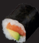
M7. LACHS AVOCADO 7,00€