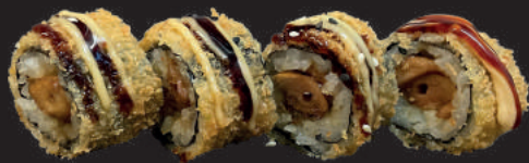
I23. MINI CRUNCHY CEE

Lachs, Frischkäse, Spinat, Unagi, Mayo, Sesam (D, G, K)