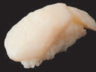
N6. JAKOBSMUSCHEL 4,00€