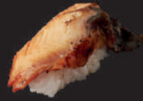
N7. GEGRILLTER AAL 4,00€