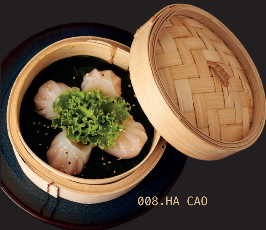
008. HA CAO