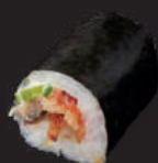
M15. GEGRILLTER AAL 8,00€