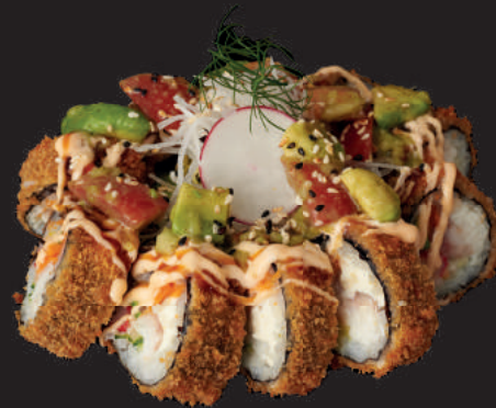
I24. CRUNCHY CHICKEN

Kleine, panierte Rollen mit Yakitori, Sesam, Chili-Mayo, Frischkäse und Unagi (D, G, K)