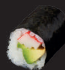
M5. SURIMI AVOCADO 5,00€